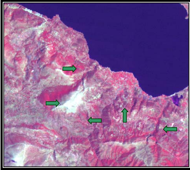
Εικ.1. Τμήμα της Δορυφορικής Εικόνας LANDSAT 5, TM, Ψευδέγχρωμης, 4-7-2 (RGB), Νότιας Αργολίδας. Διακρίνονται ίχνη ρηγμάτων (διεύθυνσης ΒΔ-ΝΑ, ΒΑ-ΝΔ), τα οποία αναγνωρίζονται είτε από την πλευρική μετατόπιση γεωμορφών, είτε με την εκδήλωση μορφολογικών ασυνεχειών. Τα βέλη δείχνουν τη θέση που διέρχονται τα ρήγματα. Part of the LANDSAT 5, TM, satellite image, false color composite, 4-7-2 (RGB), of Northern Argolis Peninsula. Faults with direction of NW-SE and NE-SW are observed. They are recognized by the side move of the geomorphological features or morphological discontinuities. The arrows indicate the fault lines.